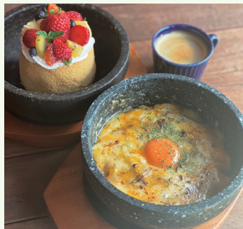
石焼きチーズカレードリア