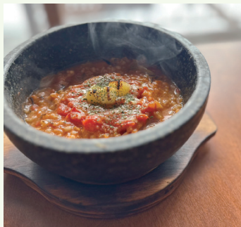
石焼きトマトリゾット